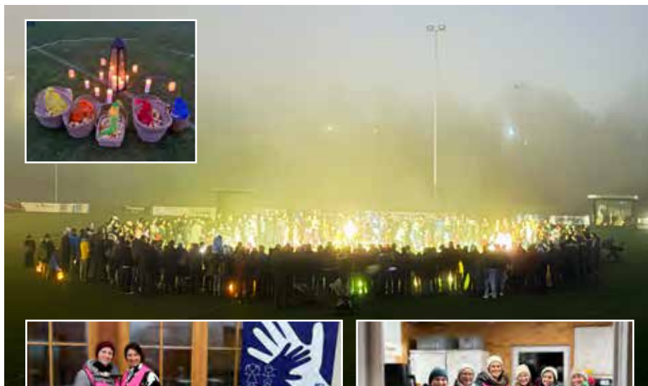
Der Elternverein unterstützte das Martinsfest der Krabbelstuben- und Kindergartenkinder.

Wenn die Blätter fallen und die Tage kürzer werden, dann heißt das beim Elternverein: Es gibt viel zu tun! Wie jedes Jahr starteten wir das Vereinsjahr 2025/26 mit kleinen Willkommensgeschenken für alle Kinder in Kindergarten, Volksschule und Mittelschule – eine liebevolle Geste, um das neue Schuljahr einzuläuten.