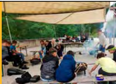
Das Würstelgrillen im Burghof ist immer wieder ein Highlight der Vermittlungsprogramme.