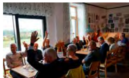
Auch bei der Wahl des Ortsparteiausschusses gab es bei der Abstimmung kein Zögern unter den Anwesenden.