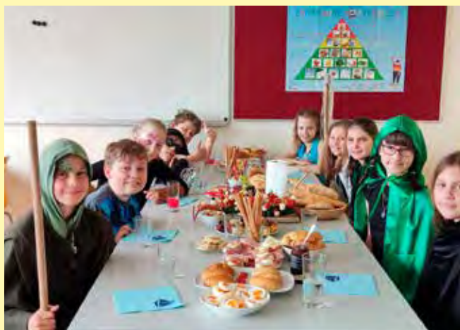
Beim Krimibrunch für Kinder am 7. März 2026 muss ein kniffliger Kriminalfall gelöst werden.

Ganz besonders in den dunklen Monaten ist es wichtig, dass sich im Ort etwas tut um dem Winter-Blues entgegen zu wirken – jeder einzelne VHS-Kurs ist ein Angebot gegen Einsamkeit und Langeweile, der zu einer lebendigen Gemeinschaft im Ort beiträgt.