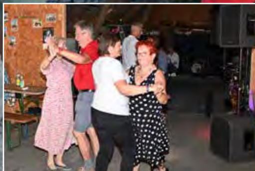
Am Nachmittag schlangen die Pensionist:innen das Tanzbein.