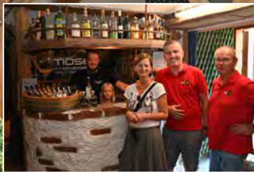
Erfreulicherweise besuchte uns auch Nationalratsabgeordnete Sabine Schatz