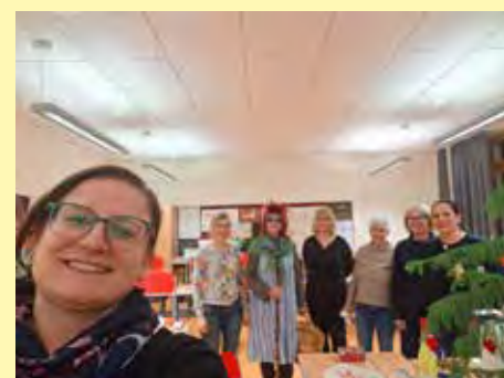
Ein Weihnachtsgruß aus dem Italienischkurs mit der italienischen Weihnachtshexe „Befana“!

Immer wieder kann so ganz unkompliziert und kostengünstig Nachhilfe oder Lernhilfe im eigenen Ort organisiert werden. Gerne berate ich Sie zu diesem Thema.