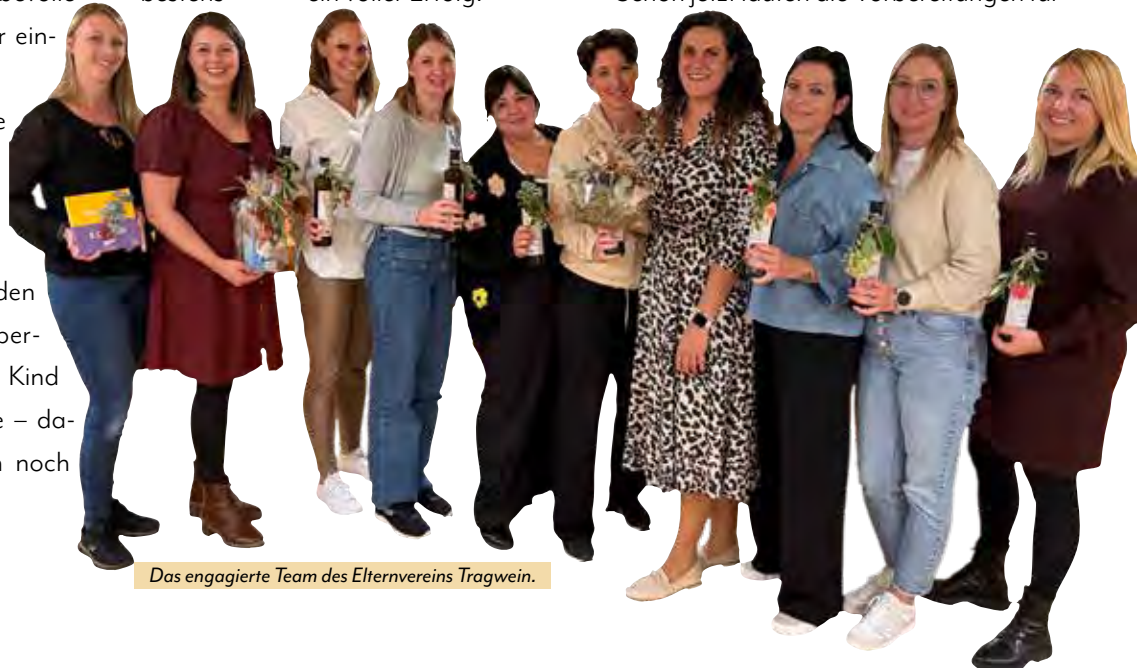
Das engagierte Team des Elternvereins Tragwein.

Doch nach dem Jahr ist vor dem Jahr: Schon jetzt laufen die Vorbereitungen für