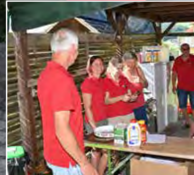
Die Küchen-Crew ist bereit – jetzt kann es richtig losgehen.