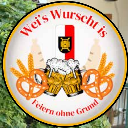
Der Innenhof beim Augl