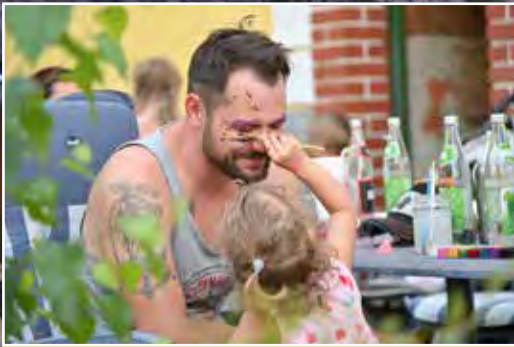
Auch so mancher Papa musste als Model für angehende Künstler:innen herhalten.