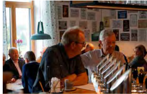
Schon vor Beginn der Jahreshauptversammlung wurde fleißig diskutiert.

Und die Stimmung bei dieser Feier bestätigte Cicero's Meinung, dass Dankbarkeit die Mutter von allem ist. Wäre dem nicht so, gäbe es kein Gesellschaftsleben mehr in Tragwein.