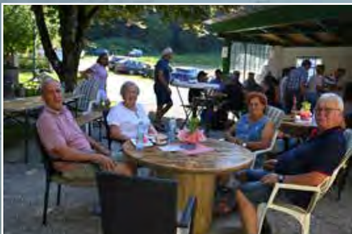
Eine kleine Pause vom Tanzen im schattigen Hof.