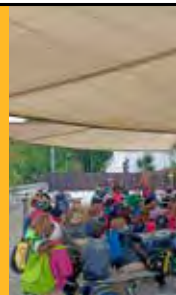
Die Schüler:innen lesen die Worte von Edeltraud.

Bevor sich die Burg Reichenstein in die Winterpause verabschiedet, sagen wir DANKE für ein Jahr voller Leben, Musik und Kreativität!