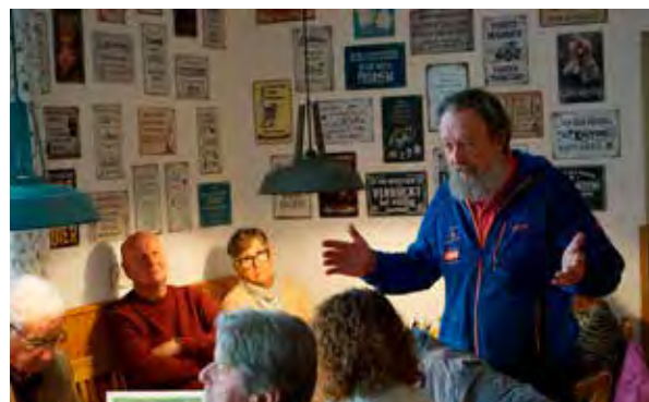
Diskussionen und Anregungen durften bei der Jahreshauptversammlung natürlich nicht fehlen.