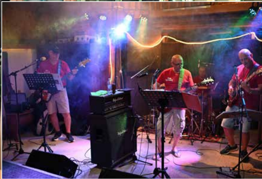
„The Kippers“ – wenn sie aufgehen raucht's gewaltig.