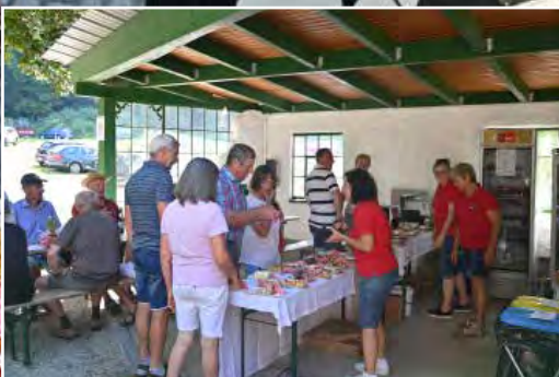
Die Damen der Kaffeebar verwöhnten die Besucher:innen mit Kaffee und herrlichen Mehlspeisen.