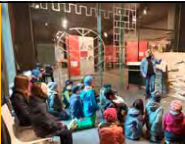
Geschichte kann so spannend sein, wenn man sie direkt erleben kann.