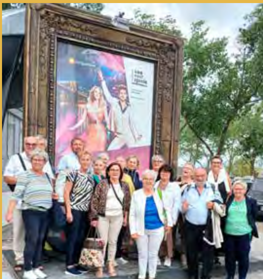
Die Tragweiner:innen freuen sich schon sehr auf eine heiße Disconacht bei den Seefestspielen Mörbisch.

Für die Vorstellung 2026 gibt es bereits 55 Anmeldung zum Musical „Ein Käfig voller Narren“.