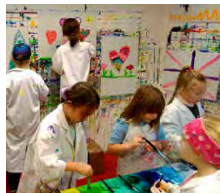
Im Atelier der Kinderkunsttage wurde Kreativität gelebt.

Heuer durften wir wieder viele Schüler bei uns auf Burg Reichenstein begrüßen. Nach einer spannenden Führung durch Burg und Museum gab es oft ein gemütliches Würstchen-Grillen im Burghof – ein Erlebnis, das Geschichte lebendig macht und den Klassenausflug unvergesslich werden lässt!