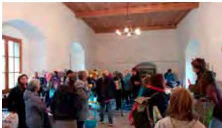
Das Schenkfest erfreut sich großer Beliebtheit, wie der Besucheransturm zeigte.

Am dritten Mai und vierten Oktober fand das Schenkfest auf Burg Reichenstein statt. Es war wunderschön zu sehen, wie viele Menschen gekommen sind, um zu tauschen, zu schenken und einfach eine gute Zeit miteinander zu verbringen.