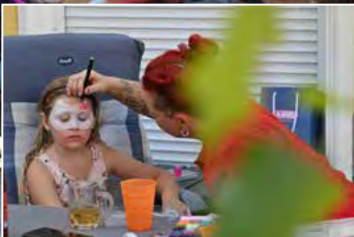
Kunstvolle Gemälde entstanden auf den Gesichtern der Kinder.

Das Team der SPÖ, und besonders die Familie Augl, haben den Tragweiner:innen wieder einen besonderen Tag geschenkt. Sie konnten in einem tollen Ambiente ein paar Stunden mit lieben Menschen beisammen sein, sich unterhalten, tanzen und Essen und Trinken genießen. Es soll sogar einige gegeben haben die laut mit den Kippers mitgesungen haben. Aber wenn sie solche Details wissen wollen, müssen sie selber zum nächsten SPÖ-Fest kommen.