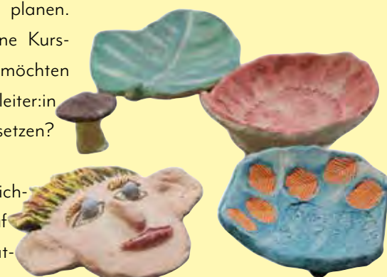
„Play with clay“ - im Töpferkurs der VHS können Sie ihre Kreativität entfalten. Der Kurs findet am 7. März 2026 statt.

fügung. Die gedruckten Programmhefte werden wie gewohnt im Jänner an die Haushalte sowie an die Nahversorger verteilt und in den Veranstaltungskalender der Gemeinde eingepflegt. Vom Tanzen für Kinder über Korbflechten, Bauchtanzen, Yoga, Pilates und KI-Vorträge bis hin zu Krimidinner oder Erziehungs-