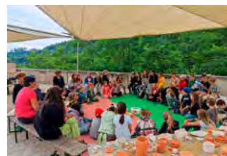
Zum Abschluss der Kinderkunsttage wurden die Kunstwerke präsentiert.

Kreativ und bunt ging es auch heuer bei unseren jährlichen Kinderkunsttagen zu!