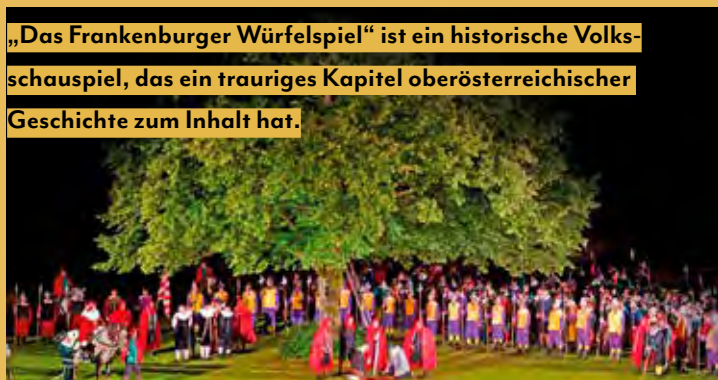
„Das Frankenburger Würfelspiel“ ist ein historische Volksschauspiel, das ein trauriges Kapitel oberösterreichischer Geschichte zum Inhalt hat.

Frankenburg zu bringen. Von uns Tragweinerern interessierten sich 33 Personen dafür, und alle waren von diesem Schauspiel tief beeindruckt.