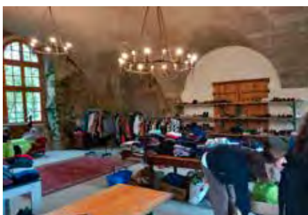
So viele wunderschöne Dinge gab es beim Schenkfest.

Am dritten Mai und vierten Oktober fand das Schenkfest auf Burg Reichenstein statt. Es war wunderschön zu sehen, wie viele Menschen gekommen sind, um zu tauschen, zu schenken und einfach eine gute Zeit miteinander zu verbringen.