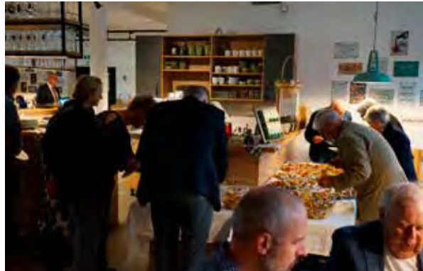
Endlich! – Das Buffett ist eröffnet!