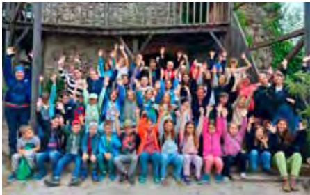
Auf Wiedersehen bis zum nächsten Jahr! Bei den Kin- derkurstagen Reichenstein.

Wir freuen uns auf viele weitere neugierige Klassen, die unsere Burg entdecken möchten.