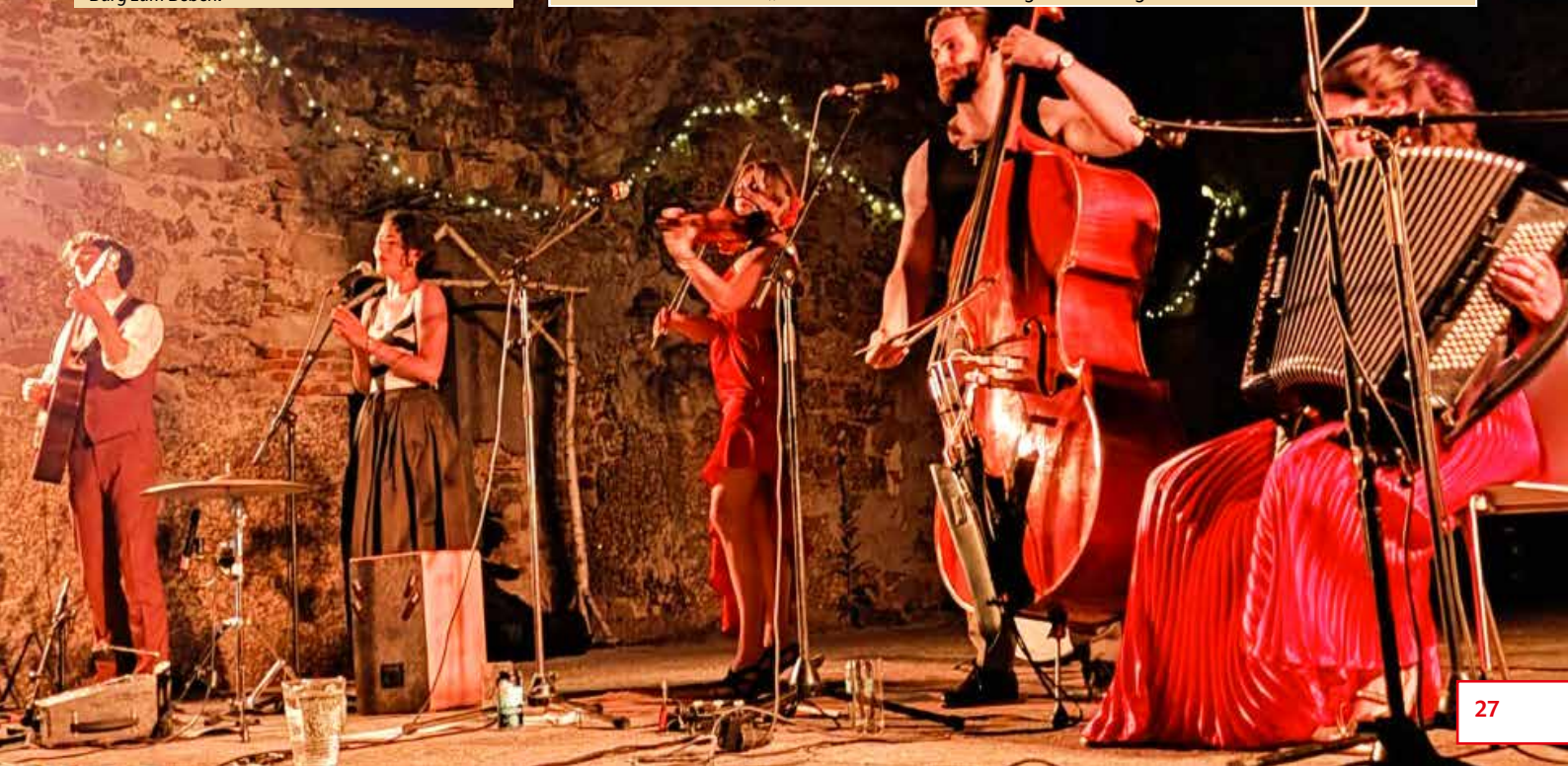
Nach der offiziellen Eröffnung der Kulturtage mit Malerei, Grafik und Skulptur brachten Baba Yaga die Burg zum Beben.