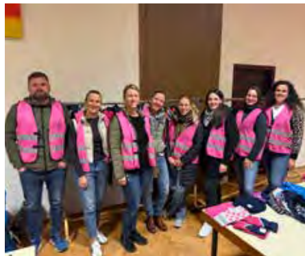
Der Elternverein organisierte auch heuer wieder gemeinsam mit dem SCK den Skibasar.