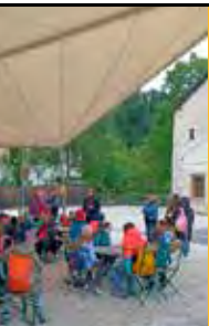
auschen gespannt den ud.