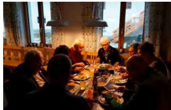
Es schmeckte wunderbar – Danke an die Schollerei im Kernlandhof!