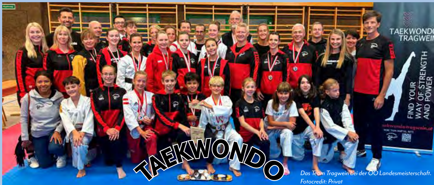
Das Team Tragwein bei der OÖ Landesmeisterschaft.