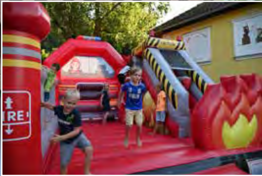
In der Hüpfburg wurde noch mehr geschwitzt als auf der Tanzfläche.

Weis ´ net Wurscht is, ob sich in Tragwein was tut, ist schon Grund genug zum Feiern. Mit einer Veranstaltung mit einem Hauch von Oktoberfest gab es am 9. August ein Fest für alle Generationen am Hof der Familie Augl.