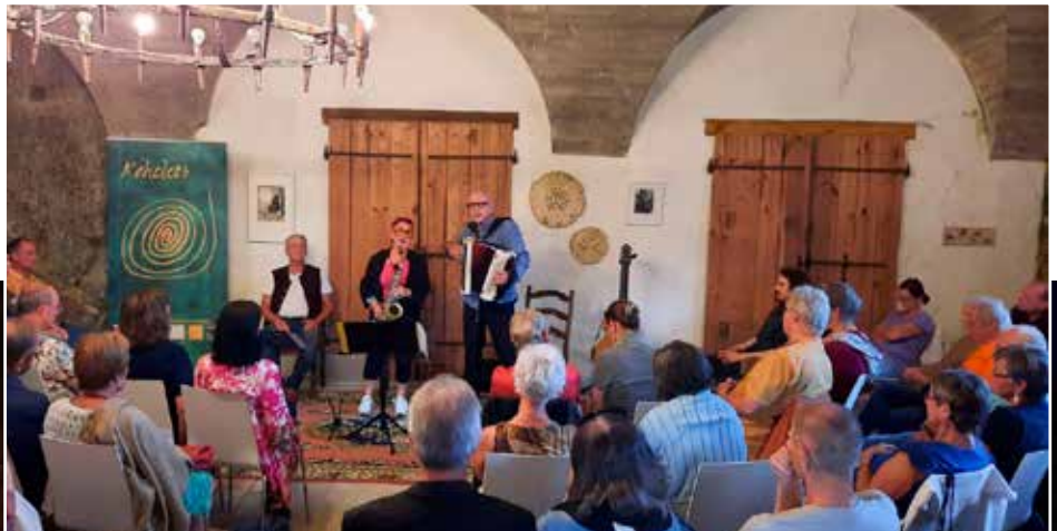
Mit einem Konzert von „Kohelet 3“ wurden die heurigen Kulturtage eröffnet.

Ob beim Zirkus, Malen, Cyanotypie oder Schmuckatelier – die kleinen Künstlerin- nen und Künstler sind mit Begeisterung dabei und lassen ihrer Fantasie freien Lauf.